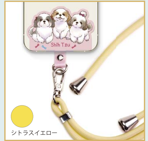
シトラスイエロー